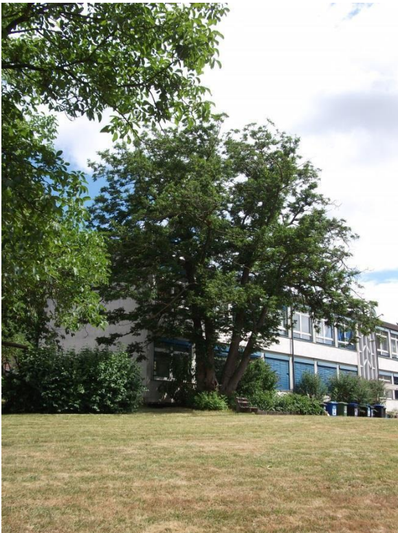
2. Südfront des ehem. Schulgebäudes mit 8 Sperlingsnestern unter den Rolladenverkleidungen