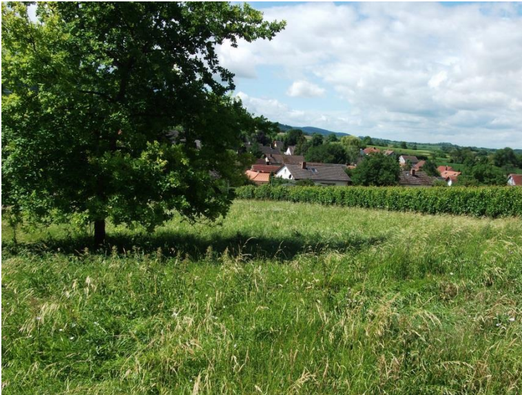
7. Westlich gelegene Fettwiese mit freistehender junger Eiche und angrenzenden Rebflächen