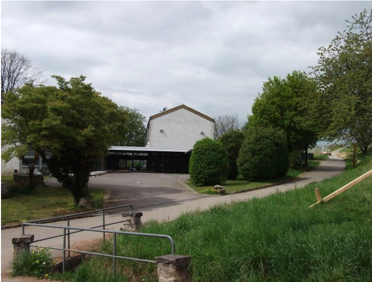
1. Baumbeständenes ehemaliges Gelände der Schule und Sporthalle in Laufen