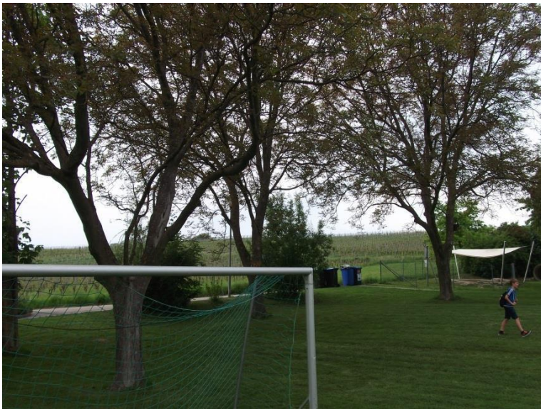
6. BAUMBESTANDENER SPIELPLATZ