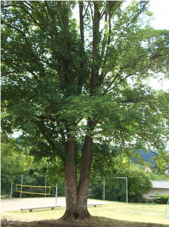
3. Bergahorn im Zentrum des Schulgeländes