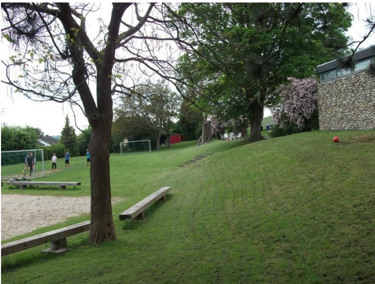
4. Spielrasen, Bolzplatz und Volleyballfeld