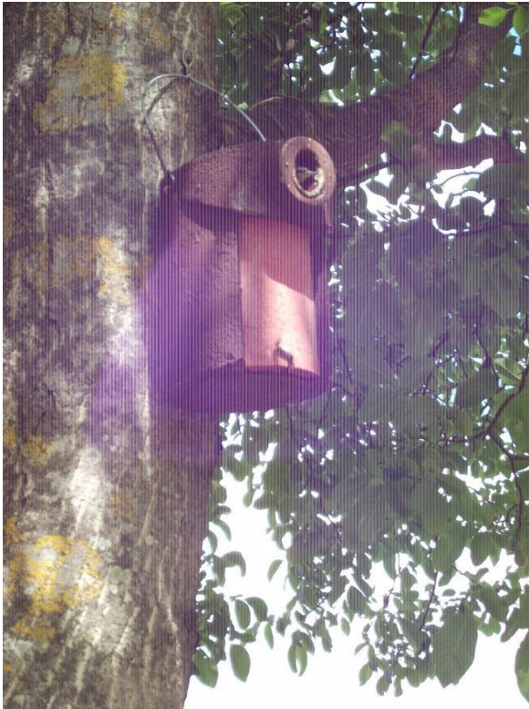
5. Nistkasten mit fast flügenden Staren am Einflugloch