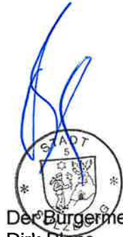
Der Bürgermeister Dirk Blens