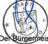
Der Bürgermeister Dirk Blens