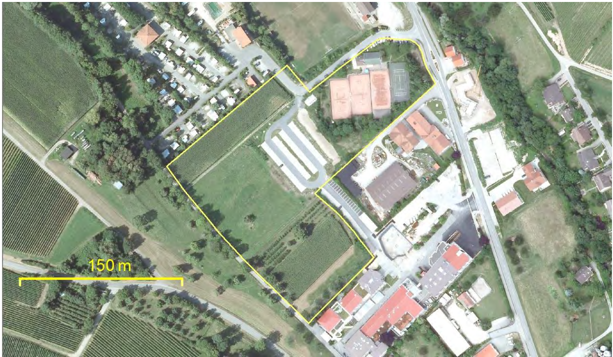
Abbildung 5: Im Plangebiet selbst finden sich als Parkplätze genutzte gepflasterte Bereiche, Äcker, Grünland, eine Obstbaumkultur und einer Gehölzallee aus Obst entlang der Betberger Straße

Westlich an das Gebiet grenzt ein Fuß- und Radweg an, der wiederum auf der vom Plangebiet abgewandten Seite durch eine Böschung begrenzt wird. Der südwestliche Teil des Plangebietes wird landwirtschaftlich genutzt. Es finden sich dort zwei (Mais-)Äcker, eine zwei Fettwiesen sowie eine Kirschbaumplantage mit zwei großen Birnbäumen. Auf der größeren, zentral gelegenen Fettwiese befindet sich ein einzeln stehender Apfelbaum, welcher Höhlen aufweist. Der südwestlich verlaufende Fuß- und Radweg wird dabei von einem Gehölzstreifen aus Hasel, Walnuss und Kirschen abgegrenzt. Auf der vom Plangebiet abgewandten Seite des Weges findet sich alte Bäume mit hohem Totholz-Anteil und Baumhöhlen.