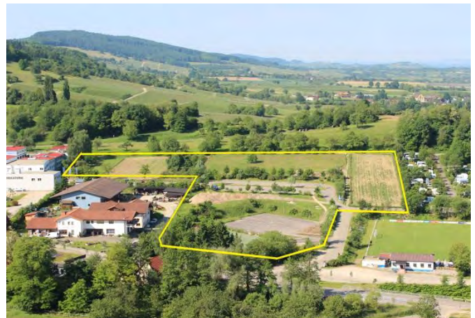
Abbildung 2: Bebauungsgebiet vom Kastellberg aus.