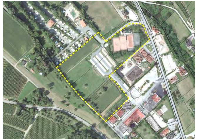
Abbildung 1: Abgrenzung Bebauungsplan (Stand: September 2013)