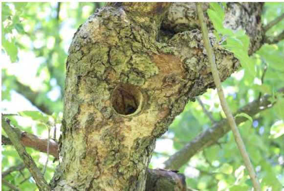
Abbildung 9: Spechthöhle 1 im zentralstehenden Apfelbaum