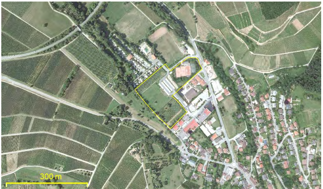
Abbildung 4: Das Gebiet trennt das bestehende Gewerbegebiet im Südosten von dem Campingplatz im Nordwesten. Südlich an den Planraum grenzt eine extensive Vernetzungsachse, die mit Streuobstnutzung südliche der Kreisstraße bis zum Wald reicht und westlich der geplanten Bebauung an eine Gehölzstreifen anschließt..