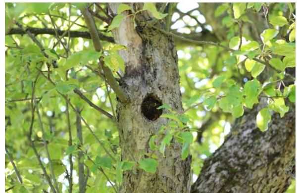
Abbildung 10: Spechthöhle 2 im zentralstehenden Apfelbaum