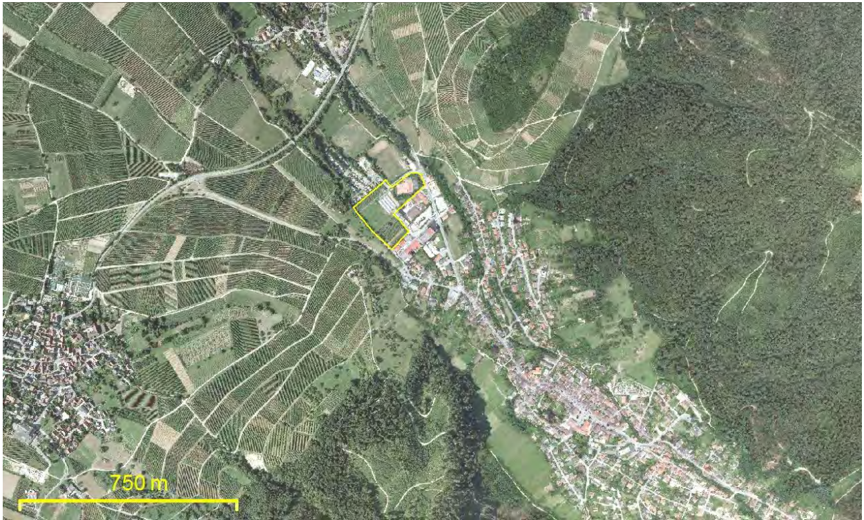
Abbildung 3: Das Plangebiet liegt in Sulzburg im Übergang zwischen Rheintalebene und Schwarzwald am Eingang zum Sulzbachtal. Im Nordosten und Südosten schließen große Waldflächen des Schwarzwaldes an. An den nicht bewaldeten Hängen wird intensiver Weinbau betrieben.

Das Gebiet umfasst eine Fläche von 3 ha.