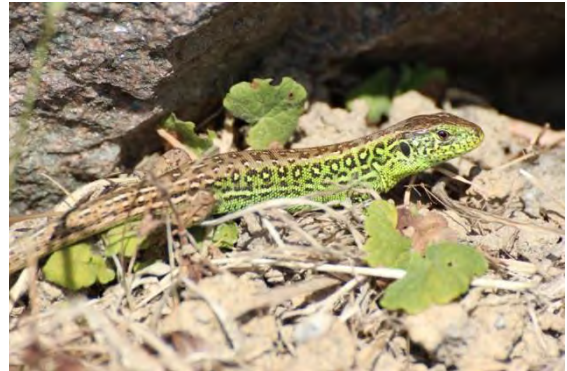
Männliche Zauneidechse am 16. Juni 2014

Im Vergleich zu anderen, in diesem Jahr durchgeführter Untersuchungen, konnten im Plangebiet kommen viele Zauneidechsen ( Lacerta agilis ) nachgewiesen werden. Der räumliche Schwerpunkt der Nachweise liegt in dem Streifen zwischen den ehemaligen Tennisplätzen mit Ruderalvegetation. Zweiter Verbreitungsschwerpunkt ist im Randbereich außerhalb des Plangebiets an der Böschung neben dem Fuß- und Radweg im Südwesten. Darüber hinaus konnten auch in geringerer Dichte Zauneidechsen in den Steinschüttung im Graben nordwestlich des Parkplatzes gefunden werden.