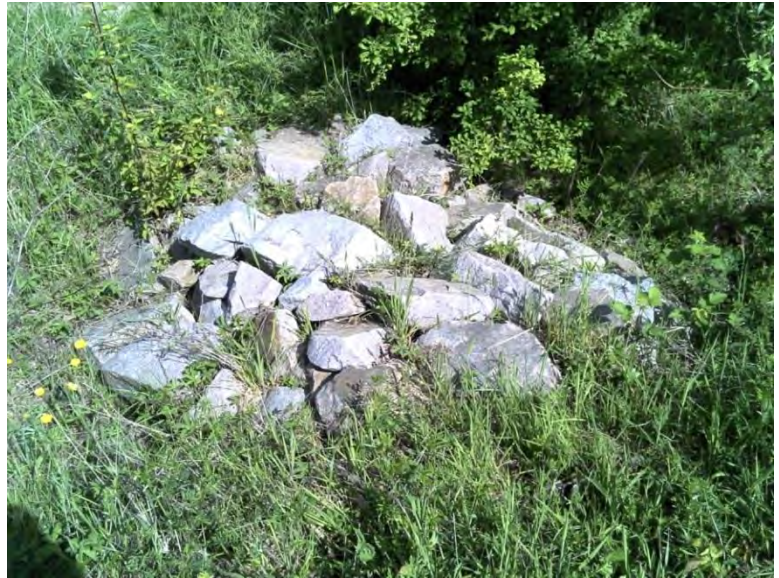
Abbildung 7: Steinschüttung am Rand des Parkplatzes.