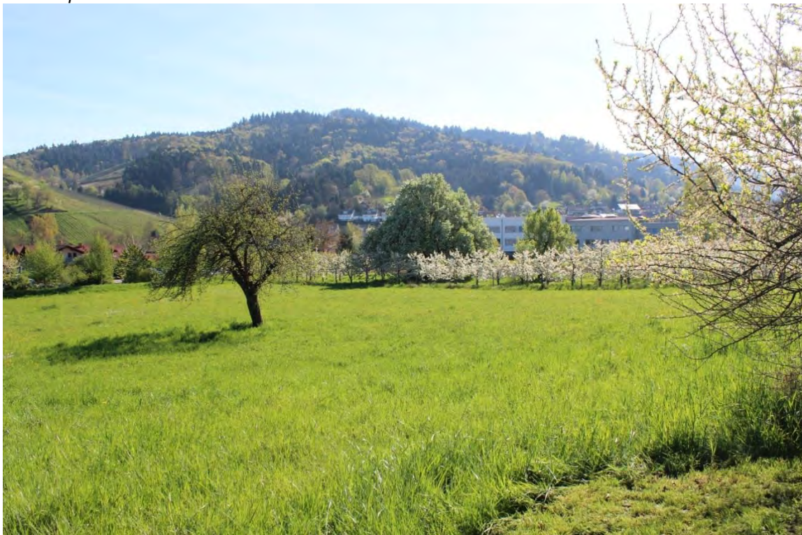
Abbildung 8: Wiese vom Fuß- Radweg aus mit Blick nach Nordost.