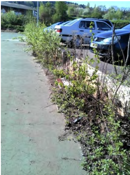
Abbildung 6: Streifen mit Ruderalvegetation zwischen ehemaligen Tennisplätzen.