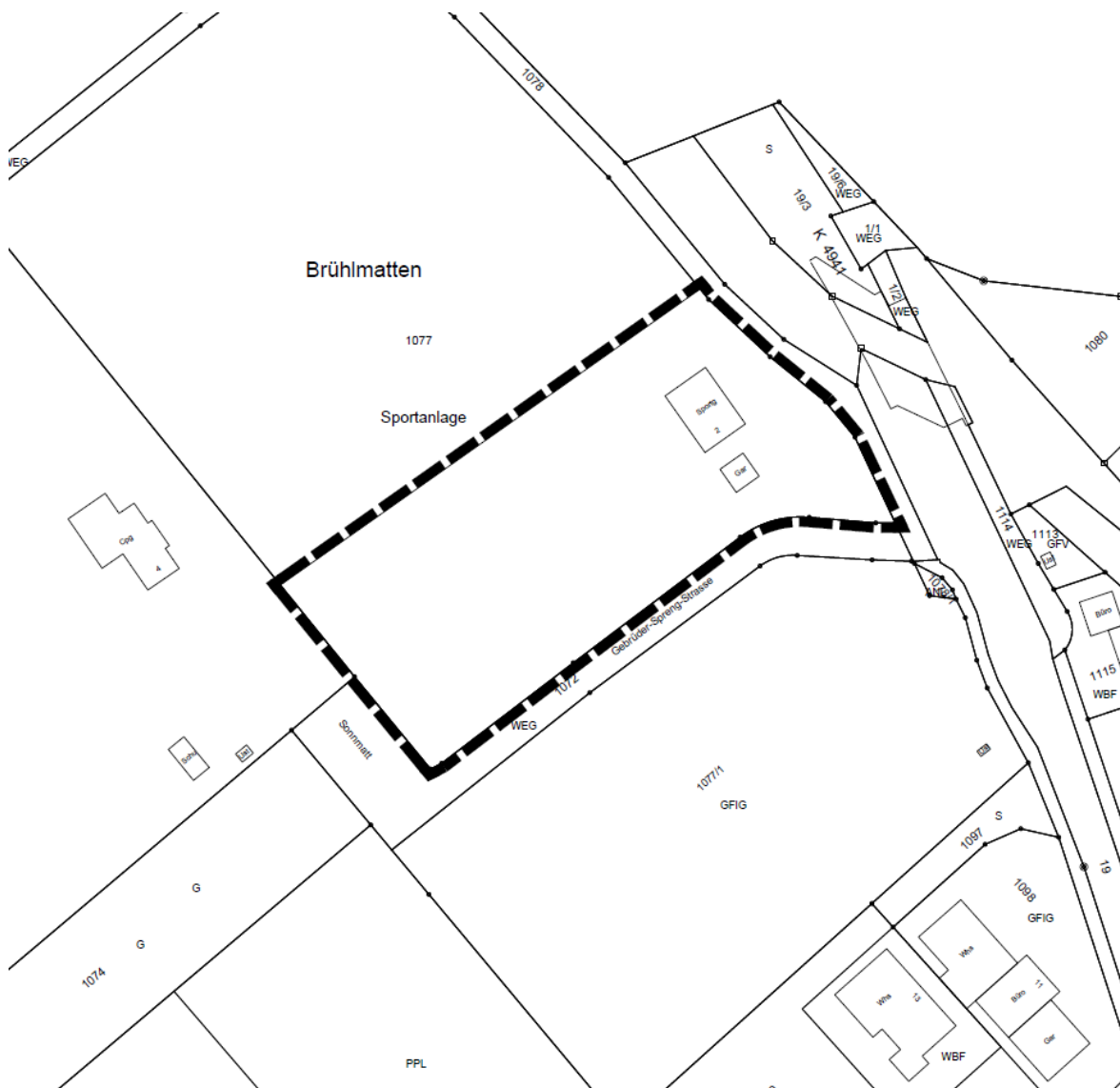
Lageplan mit vorgeschlagenem Geltungsbereich ohne Maßstab