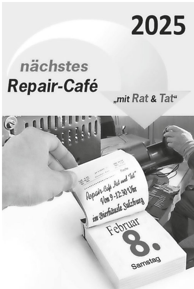
Eine Aktion der Mitbürgerliste für Sulzburg, Laufen und St. Ilgen