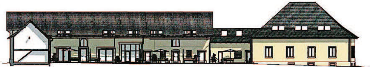
Schematische Fassadengestaltung aus Richtung des Rathauses (1:200)