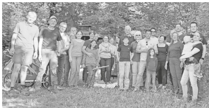
Unser Dank gilt der Gemeinde für Bereitstellung und Unterhalt dieses schönen Platzes.