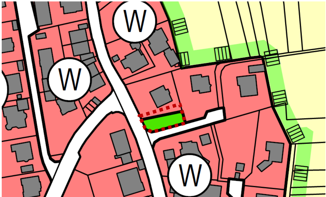
Ausschnitt aus dem wirksamen Flächennutzungsplan mit dem Änderungsbereich (ohne Maßstab)